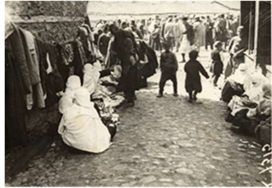
Γυναίκες μουσουλμάνες στην αγορά (1916) 20

Η εμπορική λειτουργία της πλατείας Ερμού θα χαθεί οριστικά το 1924, όταν το Δημοτικό Συμβούλιο αποφασίζει τη μεταφορά των κρεοπωλείων, ιχθυοπωλείων και λαχανοπωλείων της πόλεως εις εν και το αυτό μέρος τόσο διότι το μέτρον τούτο τυγχάνει ευεργετικόν από απόψεως υγείας όσον και ευκοσμίας της πόλεως, και ορίζει τα καταστήματα της νέας Δημοτικής αγοράς.