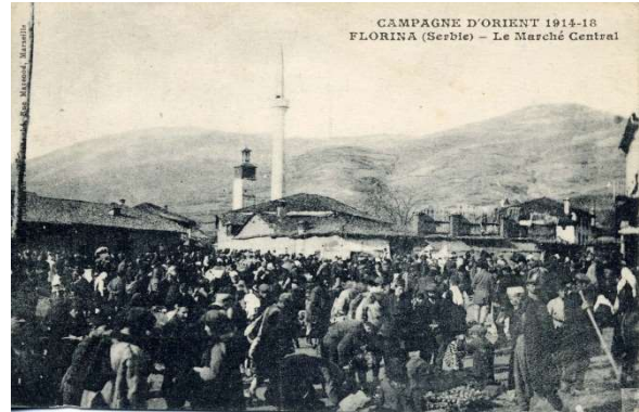
Φλώρινα: Η κεντρική αγορά 2

Το εμπορικό κέντρο της πόλης της Φλώρινας, στις αρχές του 20 ού αι, εντοπίζεται στο χώρο της σημερινής πλατείας Επτά Ηρώων 1944 , όπου είναι το κτίριο του Φ.Σ.Φ. «Αριστοτέλης». Η πλατεία Ερμού αποτελούσε το χώρο συγκέντρωσης του πολυεθνικού και πολυθρησκευτικού συνόλου της ευρύτερης περιοχής. Στον Γαλλικό Χάρτη δηλώνεται ως Place de Marché και ως τόπος τέλεσης της εβδομαδιαίας αγοράς, είναι ο μοναδικός ανοιχτός δημόσιος χώρος της πόλης που συγκεντρώνει ποικίλες λειτουργίες 3 . Μέχρι την απελευθέρωση το παζάρι γινόταν κάθε Τετάρτη, ενώ αργότερα κάθε Σάββατο. Μετά το 1912, στήθηκαν πρόχειρα ξύλινα παραπήγματα με στέγη, ξύλινους τοίχους περιμετρικά και ανοιχτά από την μπροστινή όψη. Γύρω από το χώρο του παζαριού υπήρχαν και άλλα κτίσματα που χρησίμευαν ως κρεοπωλεία, αποθήκες σιτηρών και βιοτεχνικά εργαστήρια 4 .