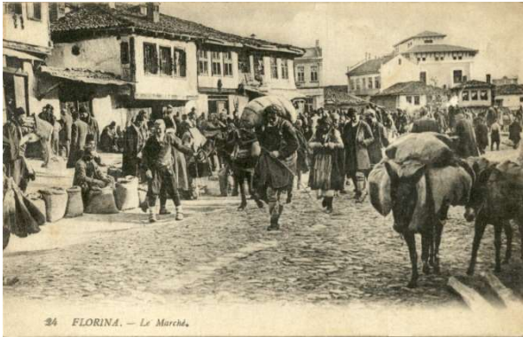
Φλώρινα: Η Αγορά 1