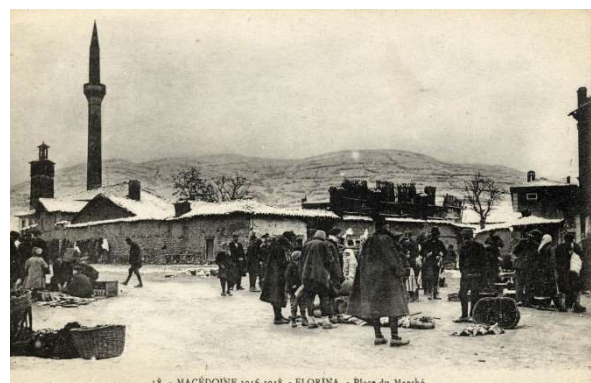
Πλατεία αγοράς (1916) 14