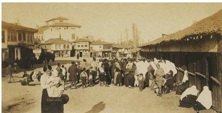
Φλώρινα: 1912 - 1918 17