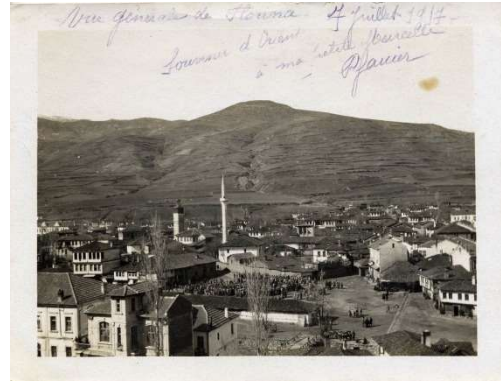
Πλατεία Ερμού 1917 6

Όπως χαρακτηριστικά αναφέρεται στην υπ' αριθμ. 44 συνεδρίαση της 24 ης Ιουνίου 1915 7 του Δημοτικού Συμβουλίου Φλώρινας, μετά από πρόταση του Δημάρχου, Αναστασίου Ναούμ, καθορίζεται επιτροπή, η οποία μεταβαίνουσα επί τόπου θέλει προβεί εις την εξεύρεσιν και εκτίμησιν του χώρου εις τον οποίον πρόκειται να ανεγερθή η δημοτική αγορά εις την οποίαν θέλουσι να συγκεντρωθούν τα κρεοπωλεία, ιχθυοπωλεία και η λαχαναγορά και η εβδομαδιαία αγορά, προσδιορίση προχείρως το πόσον της προς απαλλοτρίωσιν υπέρ του δήμου του χώρου τούτου απαιτηθησόμενης δαπάνης και υποδείξη παν μέσον αφορόν τον τρόπον της προσκλήσεως υπό του δήμου του περί ου πρόκειται χώρου συνεργαζόμενη μετά της τεχνικής υπηρεσίας του δήμου 8 .