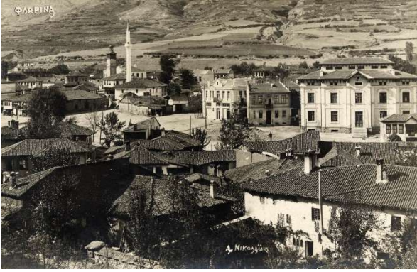
Πλατεία Ερμού 5