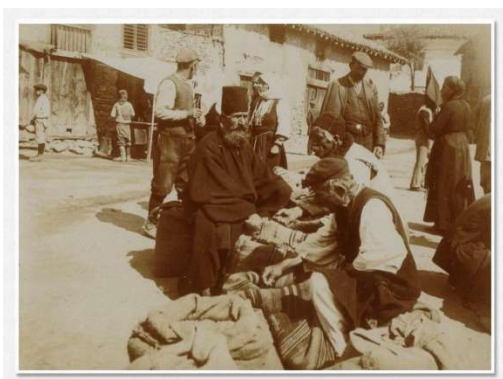
Φλώρινα: Αγορά (1917) 16

Κατά τη διάρκεια του Α΄ Παγκοσμίου Πολέμου, ο χώρος της πλατείας Ερμού και οι γύρω δρόμοι αποτελούν τον αγαπημένο τόπο φωτογράφισης των στρατιωτών της Campragne d'Orient , στα πλαίσια του οριενταλισμού, και ο χώρος, η στιγμή, η οπτική γλώσσα διασταυρώνεται με το ιστορικό συγκείμενο προκρίνοντας μια πολυεπίπεδη συγχρότιση λαών, εθνοτήτων και πολιτισμών 15 :