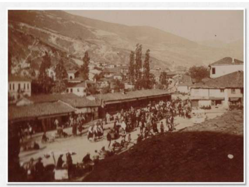
Φλώρινα (1917): Αγορά 9

Όπως χαρακτηριστικά αναφέρεται στην υπ' αριθμ. 44 συνεδρίαση της 24 ης Ιουνίου 1915 7 του Δημοτικού Συμβουλίου Φλώρινας, μετά από πρόταση του Δημάρχου, Αναστασίου Ναούμ, καθορίζεται επιτροπή, η οποία μεταβαίνουσα επί τόπου θέλει προβεί εις την εξεύρεσιν και εκτίμησιν του χώρου εις τον οποίον πρόκειται να ανεγερθή η δημοτική αγορά εις την οποίαν θέλουσι να συγκεντρωθούν τα κρεοπωλεία, ιχθυοπωλεία και η λαχαναγορά και η εβδομαδιαία αγορά, προσδιορίση προχείρως το πόσον της προς απαλλοτρίωσιν υπέρ του δήμου του χώρου τούτου απαιτηθησόμενης δαπάνης και υποδείξη παν μέσον αφορόν τον τρόπον της προσκλήσεως υπό του δήμου του περί ου πρόκειται χώρου συνεργαζόμενη μετά της τεχνικής υπηρεσίας του δήμου 8 .