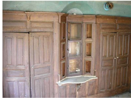
Το ταβάνι και η μουσάντρα 7 στον καλό οντά 8 της οικίας Χάρη, πριν την ανακατασκευή του 1999 9

Το αρχοντικό, με το πέρασμα των χρόνων και λόγω ανεπαρκούς συντήρησης, υπέστη σημαντική φθορά. Το 1994, χαρακτηρίστηκε διατηρητέο, ως κλασικό δείγμα Μακεδονικής Αρχιτεκτονικής, το οποίο προσδιορίζει το ιστορικό κέντρο