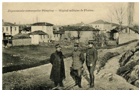
Στρατιωτικόν νοσοκομείον Φλωρίνης 5

Το αρχοντικό κατοικήθηκε από την οικογένεια του Ναούμ Α. Χάρη, ο οποίος δαπάνησε εκείνη την εποχή, το 1873, μεγάλο χρηματικό ποσό για την κατασκευή του, πληρώνοντας αδρά τεχνίτες και μαστόρους από την Κωνσταντινούπολη. Αργότερα, το σπίτι χρησιμοποιήθηκε ως στρατιωτικό νοσοκομείο από τους Γάλλους κατά τη διάρκεια της παραμονής και δράσης των γαλλικών στρατευμάτων στην περιοχή (1916-1918) 4 .