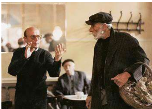
«Ταξίδι στα Κύθηρα» Γύρισμα στο εσωτερικό του Διεθνούς 1