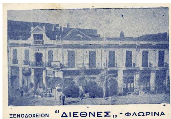
Ξενοδοχείον «ΔΙΕΘΝΕΣ» 12