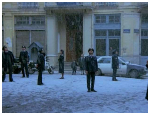
«.....» Γύρισμα στο εξωτερικό του Διεθνούς 2

Έχω κάνει 7 ταινίες μπροστά από το Διεθνές. Ήρθα και με ταινίες που δε θα έπρεπε λογικά να έχω έρθει. Έφερα μια σειρά από ανθρώπους που δεν ήξεραν τη Φλώρινα, ούτε την Ελλάδα. Ανακάλυψαν όμως την Ελλάδα και τη Φλώρινα.