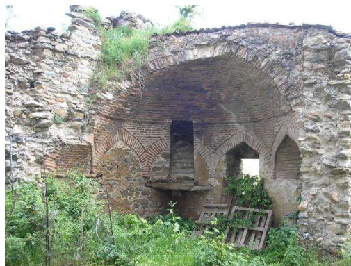
Ο κουλές της οδού Τ. Φουλεδάκη 1

Όπως κάθε βαλκανική πόλη, έτσι και η Φλώρινα, είχε πυργόσπιτα (κουλάδες, kule = πύργος), έναν αρχαίο και βυζαντινό οικοδομικό τύπο, ο οποίος είχε αναβιώσει από τα μέσα του 18 ου αιώνα. Πρόκειται για μια μεγάλη λίθινη κατασκευή, σε τετράγωνο σχήμα, η οποία εφάπτονταν στην κυρίως οικία. Η κατασκευή τους, στη συγκεκριμένη περίοδο, αντικατοπτρίζει την κοινωνική ανασφάλεια που επικρατούσε λόγω των ληστών, που λυμαίνονταν στην Οθωμανική Αυτοκρατορία, αλλά, ταυτόχρονα, συμβόλιζε την ισχύ της οικογένειας στην οποία ανήκε. Ως ένα επίπεδο, θα μπορούσε να θεωρηθεί και μια διαμαρτυρία απέναντι στη σουλτανική ή την τοπική κυριαρχία 2 .