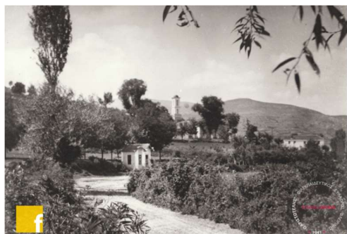
Ο Άγιος Γεώργιος και η γύρω περιοχή, στις δεκαετίες 1950 – 1960 18