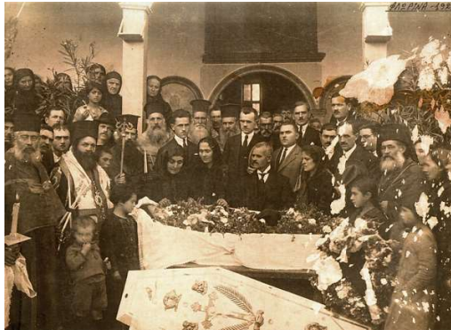
Εκφορά νεκρού στον Άγιο Γεώργιο (1925) 10

Καθώς η εκκλησία βρίσκεται στην ουσία εκτός πόλεως, το 1911, το ζήτημα απασχολεί την Εφορεία των εν Φλωρίνη Ελληνικών Εκπαιδευτηρίων , όπου και αποφασίζεται η ανέγερση κεντρικής εκκλησίας και η εξεύρεση χώρου για την οργάνωση νεκροταφείου της Κοινότητας. Τελικά αποφασίστηκε η αγορά αγρού απέναντι από την υπάρχουσα εκκλησία του Αγίου Γεωργίου, για την οργάνωση των κοιμητηρίων με δαπάνες Ελλήνων της Αμερικής 11 . Μετά την απελευθέρωση, η έδρα της Μητρόπολης μεταφέρεται στον Ναό του Αγίου Παντελεήμονα, μέχρι τότε εξαρχική εκκλησία, στο κέντρο της πόλης, στο Βαρόσι, δίπλα από τα Μητροπολιτικά Μέγαρο. Κατά τον τρόπο αυτό το ζήτημα της απόστασης του Αγίου Γεωργίου λύθηκε. Στον συγκεκριμένο ναό τελείται κι η πρώτη επίσημη δοξολογία για τα ελευθέρια της πόλης, στις 8 Νοεμβρίου 2012, παρουσία του διαδόχου Κωνσταντίνου και αρχιερατούντος του Μητροπολίτη Πολυκάρπου 12 , παράδοση που συνεχίζεται ως σήμερα στην επέτειο απελευθέρωσης της πόλης.