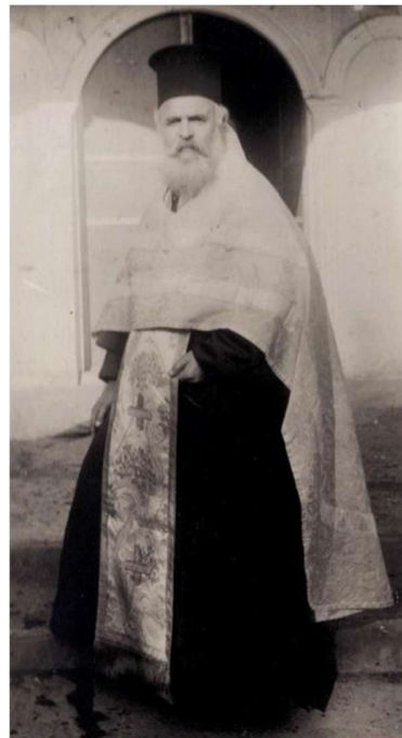
Το εσωτερικό του Ναού του Αγίου Γεωργίου και ορθόδοξος ιερέας (1916 – 197) 2