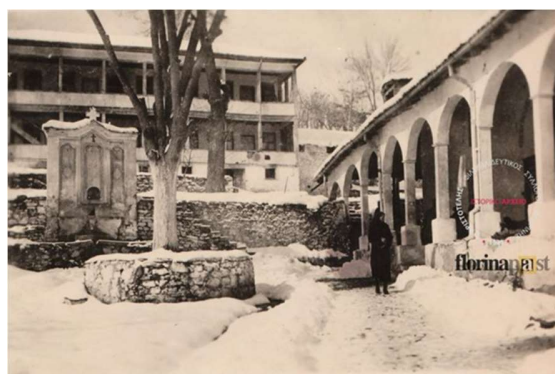
Ο Άγιος Γεώργιος της εποχή της Κατοχής (1944) 15