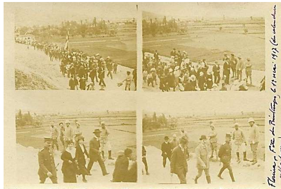
Φλώρινα. Γιορτή της Πρωτομαγιάς 1917(Στον ορθόδοξο καθεδρικό) 8

Σύμφωνα με τον Γεώργιο Μόδη, η εκκλησία χτίστηκε χωρίς σουλτανικό φερμάνι, αλλά χάρη σ' έναν «καλό» Αλβανό πασά που έδωσε την άδεια 3 . Η εκκλησία ανοικοδομείται εκτός των ορίων της πόλης, σύμφωνα με εντολές των οθωμανικών αρχών 4 . Μέχρι τότε, οι χριστιανοί της πόλης εκκλησιάζονταν στην κοντινή εκκλησία της Σκοπιάς 5 . Πρόκειται για την περιοχή της αρχαίας πόλης της Φλώρινας. Ευρήματα από το παλιό μικρό νεκροταφείο που υπήρχε ψηλότερα από τον ναό, ανάγουν την ταφική χρήση της περιοχής στα ελληνιστικά χρόνια 6 . Οι μουσουλμάνοι της πόλης, αρχικά, ονόμαζαν την περιοχή devedji bouнар , δηλαδή πηγή της καμήλας . Αργότερα, ίσως μετά την ανέγερση του ναού του Αγίου Γεωργίου, αναφέρονταν στην τοποθεσία ως hadji terpe , λόφο του προσκυνητή ή λόφο του αγίου 7 .