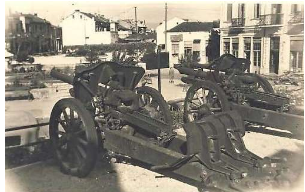
Τα κανόνια στην πλατεία της Φλώρινας στη δεκαετία του 1960 1