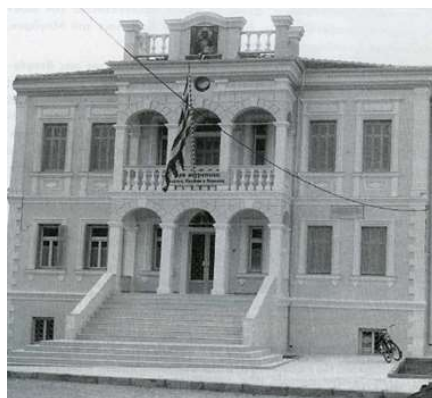
Το Μητροπολιτικό μέγαρο πριν και μετά την ανακαίνισή του το 1971 9