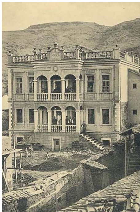
Το Μητροπολιτικό Μέγαρο το 1908 1

Στα μέσα του 19 ου αιώνα, η έδρα της Μητρόπολης Μογλενών μεταφέρεται από το Εμπόριο Πτολεμαΐδας στη Φλώρινα 2 . Αρχικά, στεγάστηκε σε ιδιωτική κατοικία και στη συνέχεια σε ένα παλιό κτίριο που αγοράστηκε από τον Τούρκο Μέτσε Μεμέτ, στο χώρο όπου, αργότερα, χτίστηκαν τα καταστήματα του της