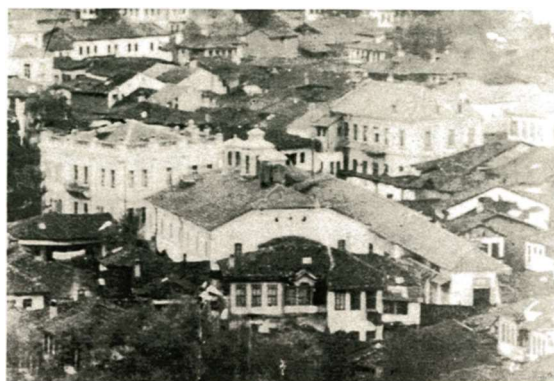
Άποψη της Φλώρινας από ΝΑ. Διακρίνεται ο Άγιος Παντελεήμονας και το Μητροπολιτικό μέγαρο 4

εκκλησίας του Αγίου Γεωργίου, στη βόρεια πλευρά της σημερινής οδού Μητροπόλεως 3 .