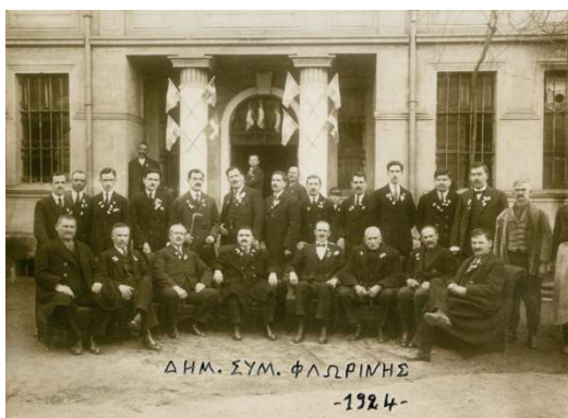
Το Δημοτικό Συμβούλιο Φλώρινας του 1924 φωτογραφίζεται μπροστά στο Δημαρχείο 1