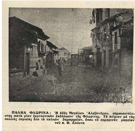
Το παλιό Δημαρχείο της Φλώρινας στη γωνία των οδών Μ. Αλεξάνδρου και Κ. Παλαιολόγου 4

Πρόκειται για ένα τυπικό αστικό σπίτι των αρχών του 19 ου αιώνα. Η είσοδος στη κεντρική σάλα του ισογείου διαμορφώνεται σε εσοχή, ενώ δυο κυκλικές κολώνες οριοθετούν το άνοιγμα, δημιουργώντας μια μορφή πρόπυλου. Τρία εσωτερικά σκαλιά οδηγούν στο υπερυψωμένο επίπεδο της σάλας, όπου στο άλλο άκρο βρίσκεται η επιβλητική εσωτερική σκάλα. Οι ακμές του κτιρίου τονίζονται με ψευδοπαραστάδες, οι οποίες και διαιρούν την επιφάνεια της όψης. Κατά τον τρόπο αυτό σηματοδοτείται η διάρθρωση του εσωτερικού χώρου, ενώ παράλληλα οργανώνονται τα ανοίγματα του κτιρίου, συμμετρικά ως προς τον κατακόρυφο άξονα της κεντρικής εισόδου. Ο εξώστης στο κέντρο του ορόφου αποτελεί μεταγενέστερη προσθήκη. Στο πλαίσιο πρόσφατης ανακατασκευής του εσωτερικού χώρου, διατηρήθηκε το σύμμετρο σχήμα της κάτοψης με μείωση του πλάτους της κεντρικής σάλας, αδιαφορώντας για την σχέση του χώρου με τα ανοίγματα της πρόσοψης 5 .