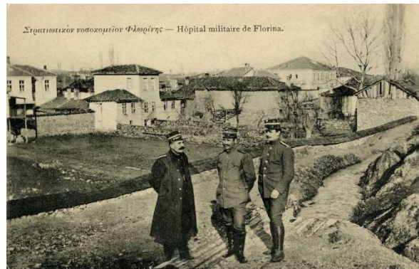
Γάλλοι στρατιωτικοί φωτογραφίζονται κοντά στο χώρο όπου ανεγέρθηκε το Γαλλικό Θέατρο 1