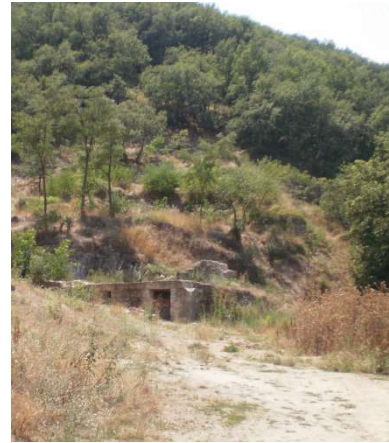
Ο χώρος του Γαλλικού Θεάτρου σήμερα 6

Σήμερα διασώζεται μόνο το κάτω μέρος του θεάτρου, ο αποθηκευτικός του χώρος, όχι όμως η σκηνή και οι θέσεις των θεατών 7 . Αξιοσημείωτο είναι ότι το δάπεδο του Γαλλικού Θεάτρου αποτέλεσε την πρώτη τσιμεντένια πλάκα που κατασκευάστηκε στη Φλώρινα, από το γαλλικό στρατό, το 1917, όπως χαρακτηριστικά αναφέρει ο Δημήτρης Μεκάσης: Το θέατρο κατασκευάστηκε από τετραγωνισμένες πέτρες και το δάπεδό του από οπλισμένο σκυρόδεμα (μπετόν αρμέ) 8 .