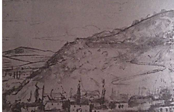
Ο λόφος του Αγίου Παντελεήμονα, όπου οι Γάλλοι το θέατρό τους, στο «Διαμάντη» 3