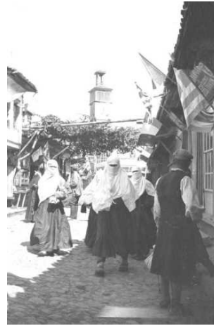
Φλώρινα: La tour carrée 7