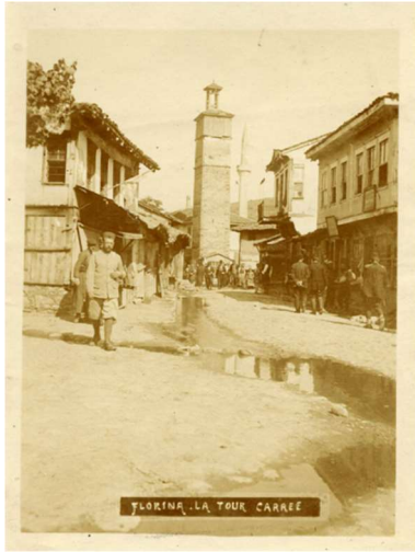
Φλώρινα: La tour carrée 6