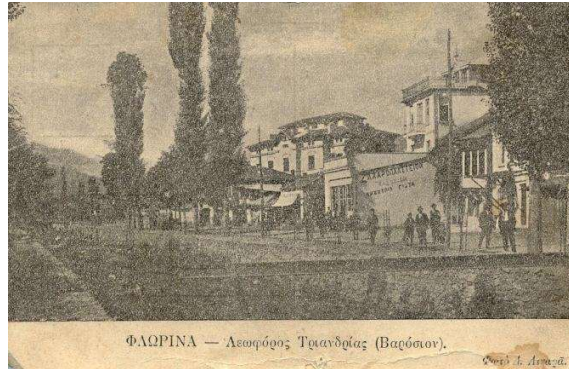
Φλώρινα - Λεωφόρος Τριανδρίας (Βαρόσιον) Διακρίνεται το Ζαχαροπλαστείο ΟΛΥΜΠΙΑ 3

Στο συγκεκριμένο κτίσμα, λειτουργούσε, από το 1918, το ζαχαροπλαστείο «ΟΛΥΜΠΙΑ» του Δημητρίου Γιάτα, που καταγόταν από το Μοναστήρι. Είχε αποκτήσει το παρατσούκλι «Ο Σπουδαίος» επειδή, όταν οι πελάτες τον ρωτούσαν: «Ωραία τα γλυκά;» εκείνος απαντούσε πάντα: «Σπουδαία» και έτσι προέκυψε προσωνύμιο τόσο το δικό του, όσο και του καταστήματός του. Το ζαχαροπλαστείο, κάπου στη δεκαετία του '30 μεταφέρθηκε και στεγάστηκε, μέχρι τις αρχές της δεκαετίας του '50, στο παλιό κτίριο επί της οδού Παύλου Μελά στον πεζόδρομο 4 .