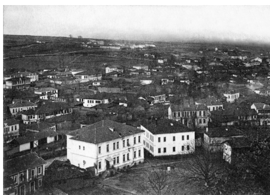
1ο & 2ο Δημοτικά Σχολεία Φλώρινας 1

Από το 1905 και έως το 1914, η ελληνική εκπαίδευση στην Φλώρινα έχει κοινοτικό χαρακτήρα. Τα σχολεία τα συντηρεί η ελληνική κοινότητα και η διαχείριση των οικονομικών πόρων ανήκει στη Μητρόπολη 2 . Το Αρρεναγωγείο Φλώρινας στεγάστηκε και λειτούργησε, το Σεπτέμβρη του 1906, στην κατοικία του Ιζέτ- Πασά, σε οικόπεδο έκτασης 3.322 τ.μ., η οποία αγοράστηκε από την ελληνορθόδοξη κοινότητα της Φλώρινας, το 1905, όταν ο ίδιος ετοιμαζόταν να φύγει και να εγκατασταθεί μόνιμα στο Μοναστήρι. λόγω των βιαιοπραγιών εναντίον των μπέδων που σημειώνονταν εκείνη την περίοδο στην περιοχή της Φλώρινας. Το ποσό που ζήτησε ο Ιζέτ-πασάς από την ελληνική κοινότητα ήταν 1500 λίρες. Μάλιστα, έγινε γνωστό ότι η βουλγαρική κοινότητα της πόλης του πρόσφερε 2000 λίρες. Για να συγκεντρωθεί το ποσό αυτό, πραγματοποιήθηκε έρανος, που οργανώθηκε από τον υποδιοικητή Φλώρινας Ταχσίν Μπέη, με τη συμμετοχή του χριστιανικού πληθυσμού της πόλης. Παράλληλα, συνεισέφερε οικονομικά και η επιτροπή του Νηπιακού Επιμελητηρίου Μελά στην Αθήνα, καθώς και οι Ομογενείς της Αμερικής. Επίσης, προτάθηκε να χρησιμοποιηθεί ένα μέρος των χρημάτων από τους πόρους του Τσουφλείου Κληροδοτήματος. Τελικά, η ελληνική Κυβέρνηση ανέλαβε τη διαχείριση όλων των διαθέσιμων πόρων και κατέλαβε η ίδια το ποσό των 1500 λιρών στον Ιζέτ- πασά 3 .