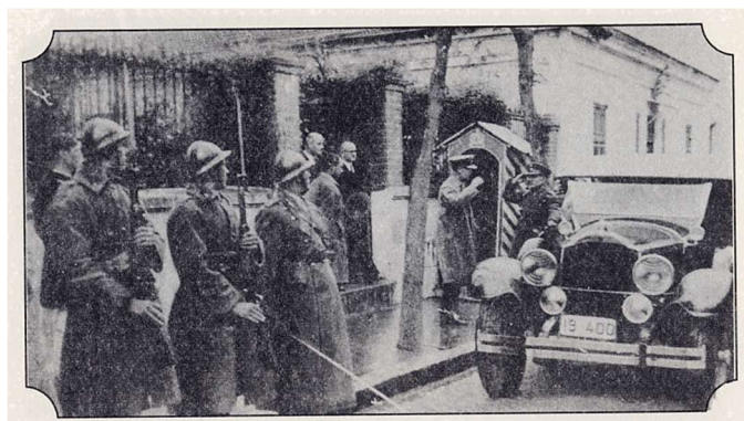
Ο Βασιλιάς Γεώργιος Β΄, κατά την επίσκεψή του στη Φλώρινα, το 1935 & 1936, εξέρχεται από το μέγαρο Εξάρχου 7

Σήμερα, στο κτίριο στεγάζεται το Μουσείο Σύγχρονης Τέχνης Φλώρινας. Η πώληση του ακινήτου πραγματοποιήθηκε στις 07 Αυγούστου 1998 στην